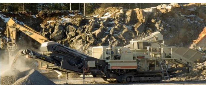
図2 ロコトラック LT200HPS