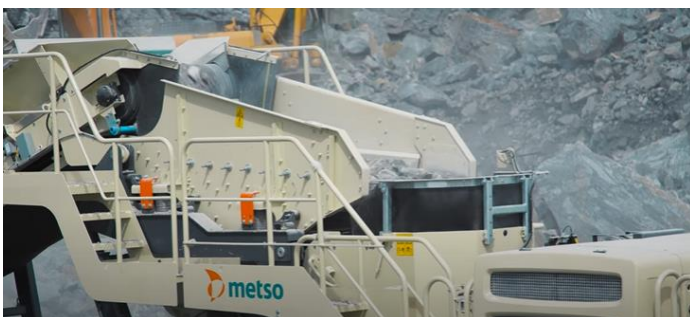
図7 LT200HPX スクリーン