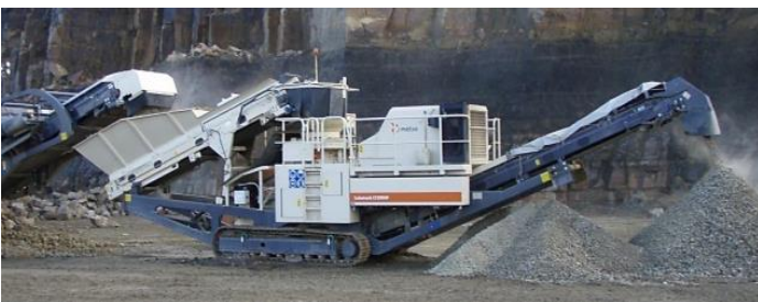
図1 ロコトラック LT200HP

投入された原料は投入ホッパーからベルトフィーダーによりスクリーンへ送られる。スクリーンで一次選別された原料のオーバーサイズは、HP200（コーンクラッシャー）に投入され破碎される。スクリーンアンダーはサイドコンベヤで機外に排出することも可能である。また、メインコンベヤで HP200 の破碎品と一緒に機外に排出することもできる。