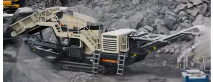
図3 ロコトラック LT200HPX

この度、Metso では、2次破碎機が多機能化、能力UPのニーズに応えるために、投入コンベヤと2次破碎機との間にスクリーンを設けた LT200HPX（図3に写真を示す。）22年1月より日本で発売をすることとなった。