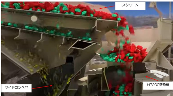
図5 LT200HPX 原料流れ図