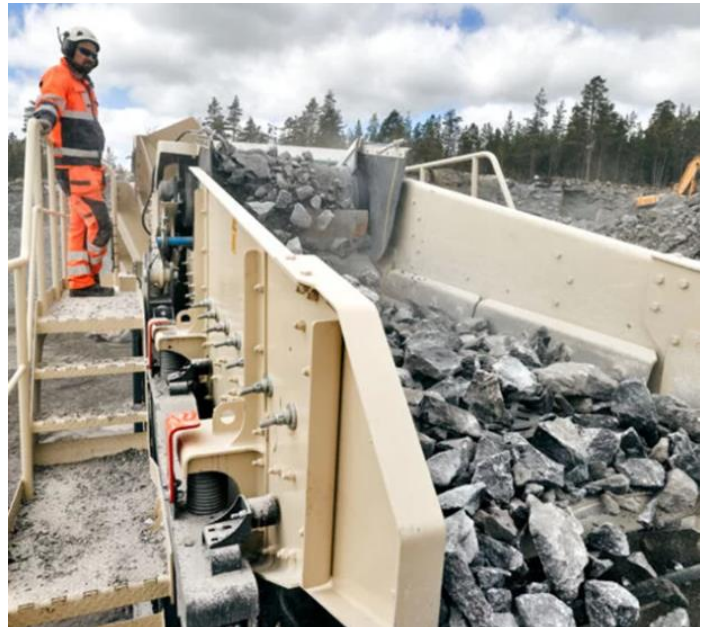
図8 LT200HPX スクリーン

HP200の前にスクリーンがついているため、原料の一次選別が可能である。選別されたスクリーンアンダーは機外排出することにより1台の破砕機で2種類の製品の生産ができる(図6、7、8)。また、HP200の投入前で一次選別(例えば-40 mm)をすることで、HP200の負荷を低減でき、その分一次選別をしない場合(LT200HP)より処理量が多い。(同様の条件でLT200HP(スクリーン無し)に比べ20~30%能力がUPする。)(図9)