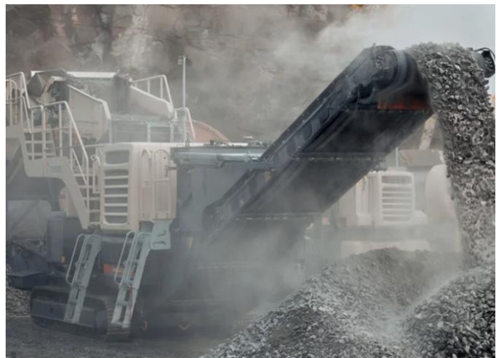
図9 LT200HPX 稼働状況