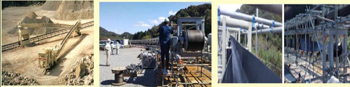
図5 電動式破砕機、フリーラインコンベヤ写真