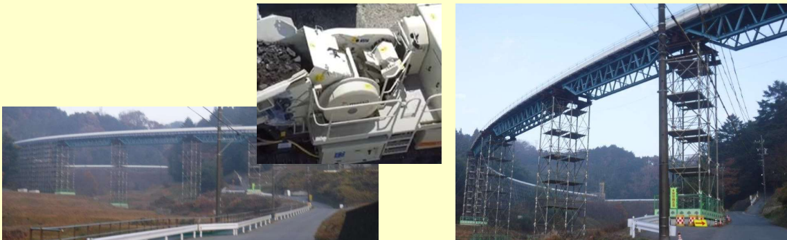
図6 A社納入、稼働中の電動破砕機、フリーラインコンベヤ写真