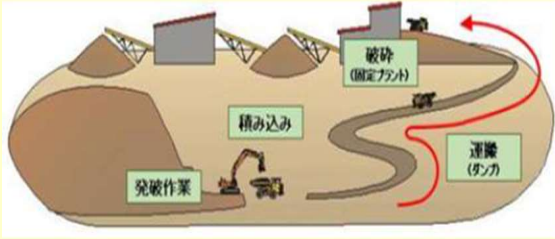
図3 従来工法 (ダンプ+固定式破砕機)