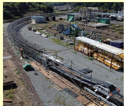
図2 フリーラインコンベヤ