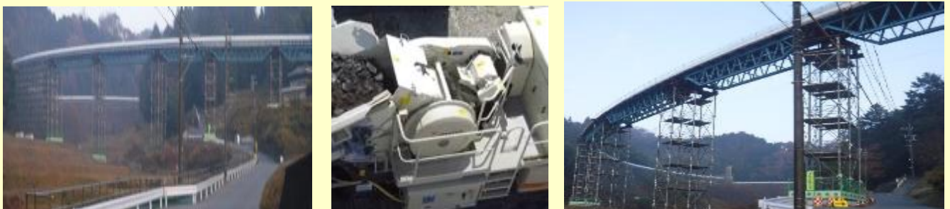
図6 A社納入、稼働中の電動破砕機、フリーラインコンベヤ写真