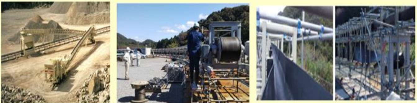
図5 電動式破砕機、フリーラインコンベヤ写真