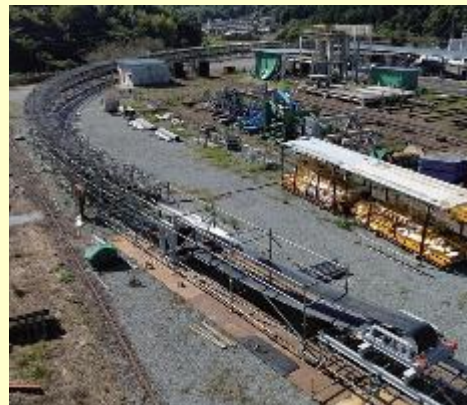
図2 フリーラインコンベヤ