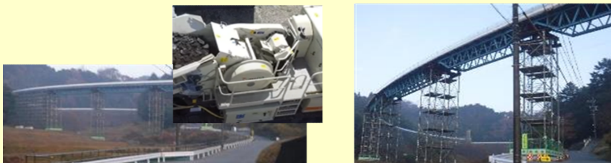
図6 A社納入、稼働中の電動破砕機、フリーラインコンベヤ