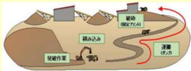
図3 従来工法（ダンプ+固定式破砕