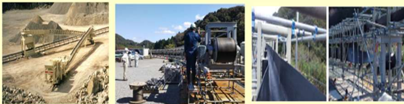
図5 電動式破砕機、フリーラインコンベヤ写真