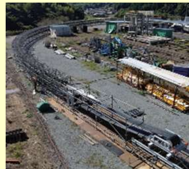
図2 フリーラインコンベヤ