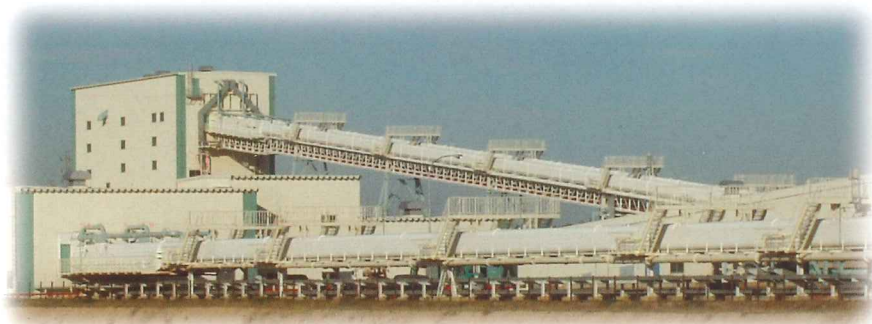
石炭コンベヤ 能力:1100t/h