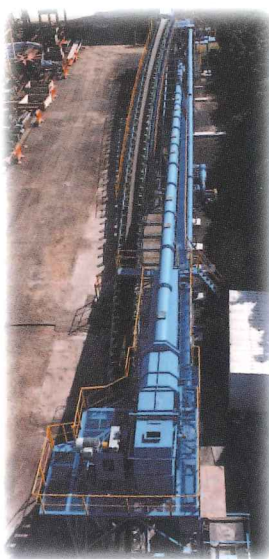
エア浮上コンベヤ 当社開発機