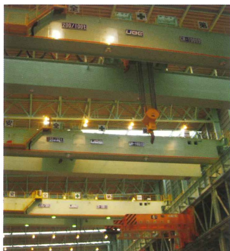
200/100t×34m 1基・200/60t×34m 2基・200/30t×34m 2基