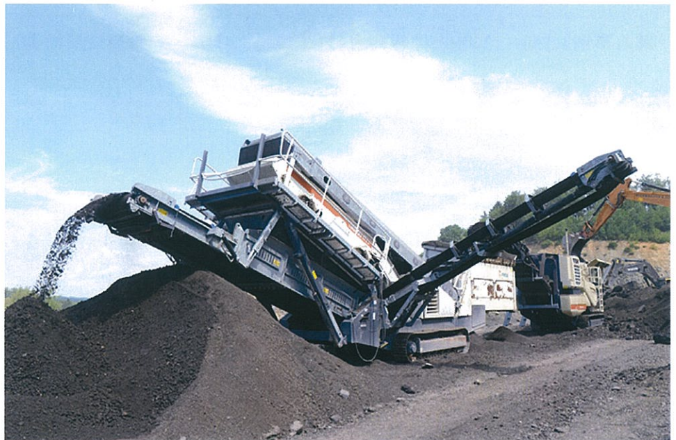
「導入事例」LT96+ST272の組み合わせによる、-40、+40 生産設備(能力300t/H)