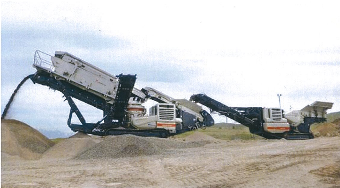
「導入事例」LT96+LT200HPSの組み合わせによる、20-05、-5 骨材生産設備(能力200t/H)