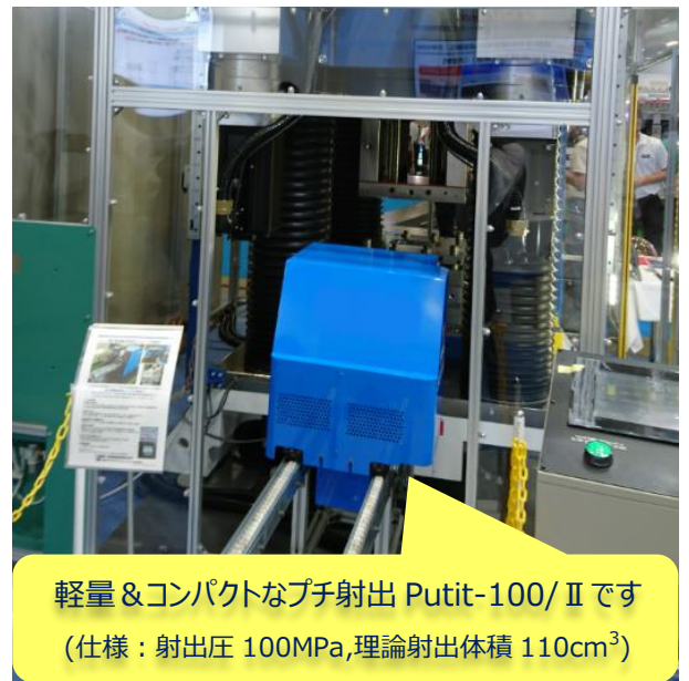
軽量 & コンパクトなプチ射出 Putit-100/II です (仕様：射出圧 100MPa, 理論射出体積 110cm 3 )