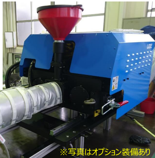
※写真はオプション装備あり