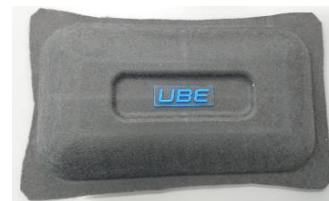
裏面射出 + 染出射出成形 (プチ射出にて成形)