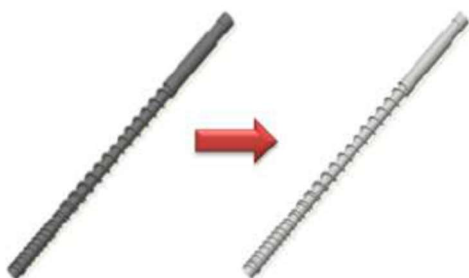
【クリーニングによる再生】